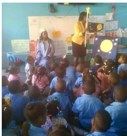
“Y de repente se fue la luz... de la luna” en la Biblioteca de las Hojas Anchas, República Dominicana

Taller de serigrafía o estampado. Organiza un taller donde los estudiantes puedan aprender técnicas de serigrafía o estampado y crear sus propias camisetas, bolsos u otros artículos con diseños relacionados con el Día de la Mujer.